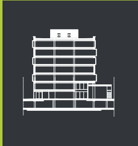
Przekrój Cross section