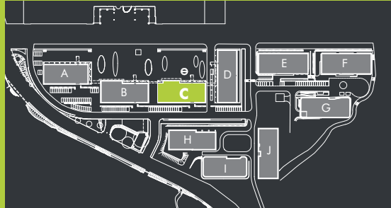
Lokalizacja w kompleksie Location within the complex