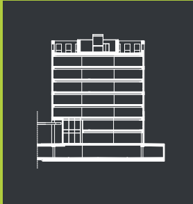
Przekrój Cross section