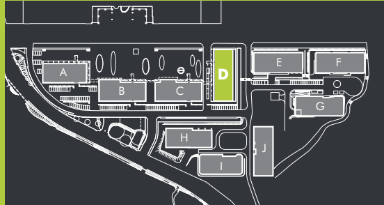
Lokalizacja w kompleksie Location within the complex